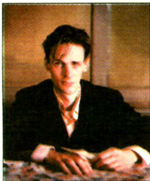
CON LA FILARMÓNICA - El connotado pianista Richard Goode se presentará el próximo jueves a las 7.30 con la Filarmónica de Nueva York, bajo la conducción de Sir Colin Davis, en el Merkin Concert Hall. Información en www.newyorkphilharmonic.org

EL BOLERO DE BIARRITZ - El Ballet francés Biarritz celebra su debut en Nueva York con una breve temporada en el Teatro Joyce (175 de la Octava Avenida) entre el 5 y el 10 de este mes. Presentará 'Un homenaje a los ballets rusos' cuatro clásicos de la época glamorosa de Diaghilev radicalmente transformados: 'L'après midi d'un faune', 'Pulcinella', 'Bolero' y 'El espectro de la rosa'. Informes en www.joyce.org o en el teléfono 212-242-0800.