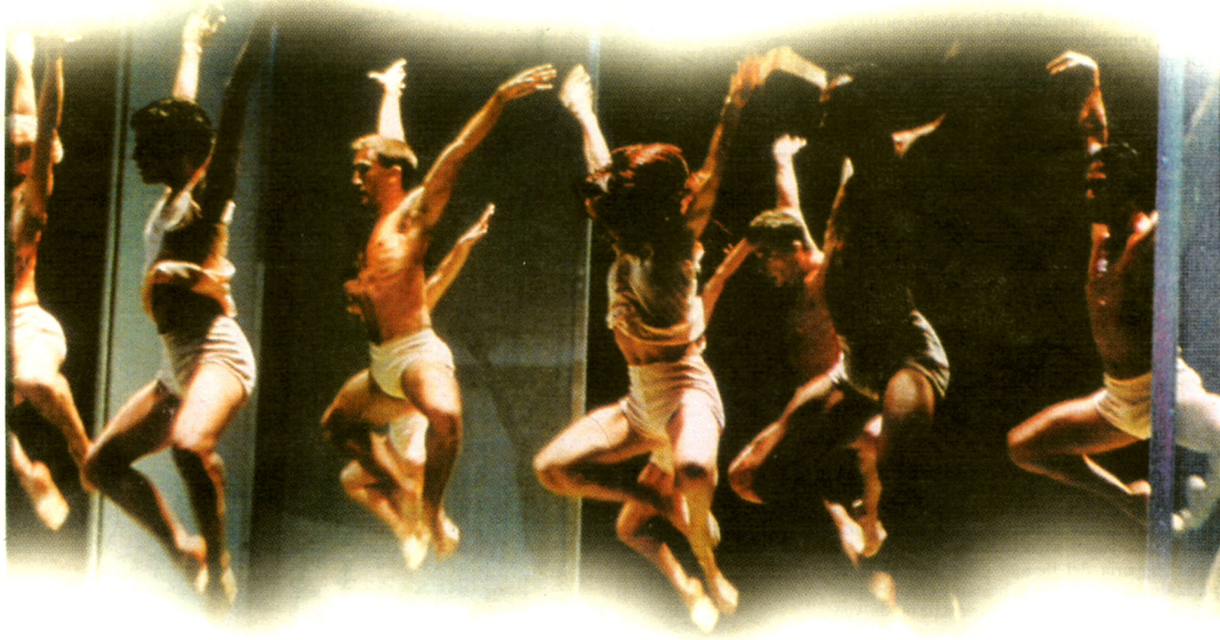
EL BOLERO DE BIARRITZ - El Ballet francés Biarritz celebra su debut en Nueva York con una breve temporada en el Teatro Joyce (175 de la Octava Avenida) entre el 5 y el 10 de este mes. Presentará 'Un homenaje a los ballets rusos' cuatro clásicos de la época glamorosa de Diaghilev radicalmente transformados: 'L'après midi d'un faune', 'Pulcinella', 'Bolero' y 'El espectro de la rosa'. Informes en www.joyce.org o en el teléfono 212-242-0800.